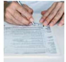
Consentement du donneur Renseignements cliniques