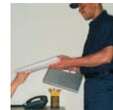
Transport de la tête dans son cryokit