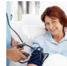
Selection du donneur